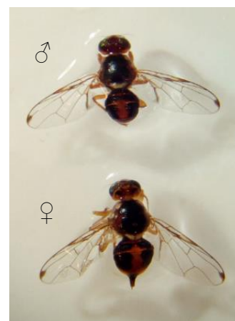
Macho y hembra B. oleae .

Se aconseja vigilar el cultivo, a partir de estas fechas, cuando se ha alcanzado el estado fenológico de hueso endurecido, observando la evolución de la plaga tanto cuantificando las poblaciones de adultos en trampas como su incidencia sobre las aceitunas mediante la realización de muestreos de frutos.