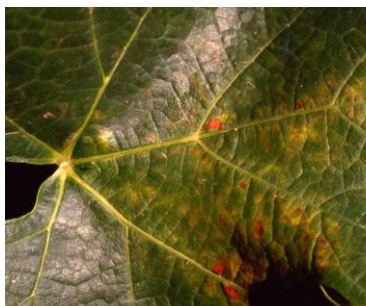
Primeros síntomas en hojas (punteaduras).

Se recomienda vigilar la parcela y tratar al observarse los primeros síntomas, realizar los tratamientos de forma localizada en los focos o rodales si el ataque está en sus inicios, o toda la parcela en caso que el ataque sea generalizado. La época más sensible a los ataques de este ácaro coincide con condiciones de alta temperatura, 30-32 ° C, y humedad relativa baja. En algunas zonas de la región se han comenzado a observar focos de infestación.