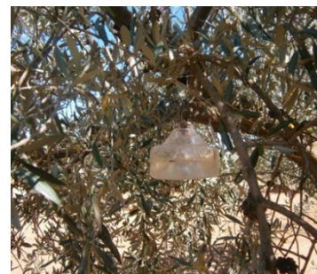
Tipo mosqueros McPhail