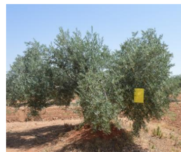
Placa cromotrópica amarilla engomada cebada con feromona

El primer tratamiento en parcheo o en bandas se debe realizar cuando se supere el siguiente umbral: capturas superiores a una mosca por mosquero McPhail y día, 60% o más de hembras capturadas con huevos y el 1% de aceituna picada por mosca.