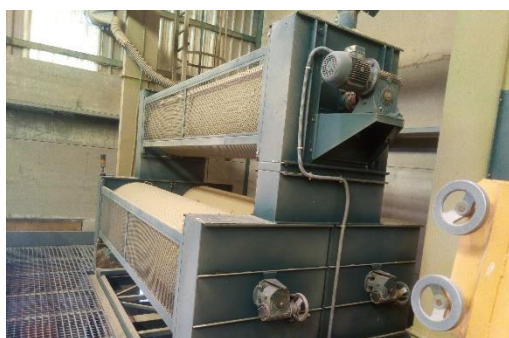
Tambores rotatorios de limpieza de grano.