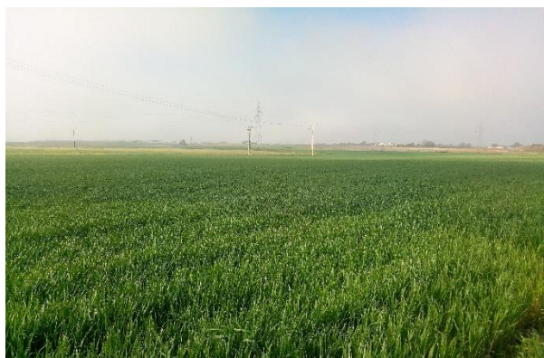
Campo de trigo duro sembrado con semilla certificada.