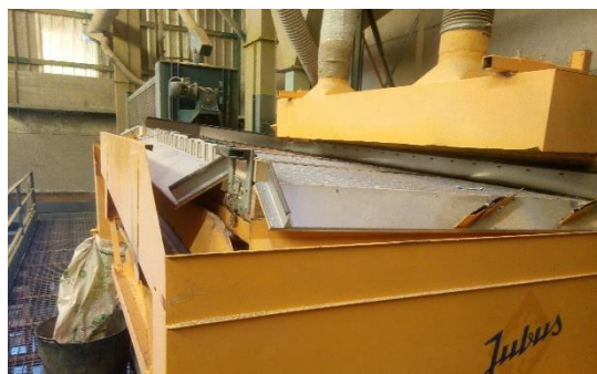
Separadora de calibres.