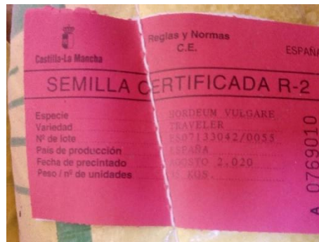
Semilla certificada de segunda generación.