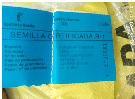
Semilla certificada de primera generación.