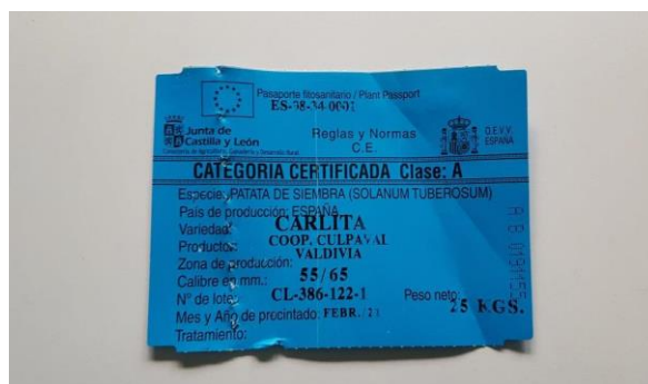
Pasaporte Fitosanitario de patata de siembra.

El Pasaporte Fitosanitario (PF) es la marca oficial (ETIQUETA) que acompaña al material vegetal de reproducción en su movimiento por el territorio de la UE cuyo objeto es acreditar que dicho envío va libre de plagas cuarentenarias y que cumple con los niveles de tolerancia exigidos para las RNQPs (plagas reguladas no cuarentenarias).