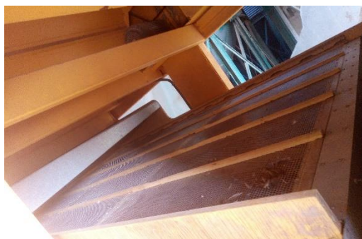
Cribas de limpieza de semillas herbáceas.

Se entiende por Comercialización la venta, la tenencia destinada a la venta, la oferta de venta y toda cesión, entrega o transmisión con fines de explotación comercial, de semillas o de plantas de vivero, incluido cualquier consumidor, a título oneroso o no.