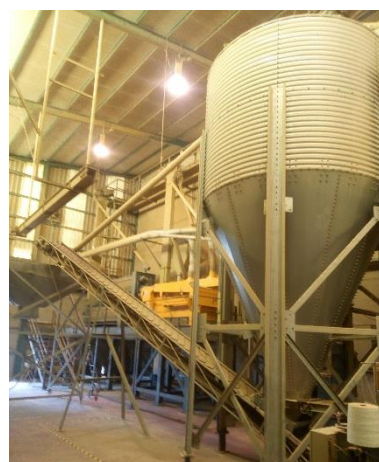
Tolva de alimentación.